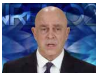
MAURIZIO CROZZA Festival di Sanremo 2017