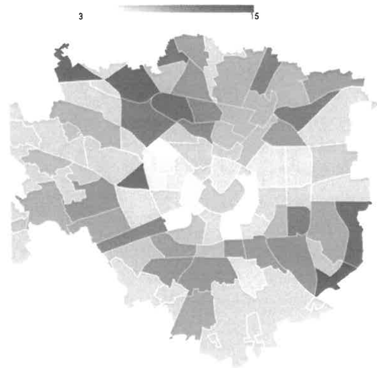
% di giovani residenti 15-29 anni che non studia e non lavora per quartiere della Città Metropolitana